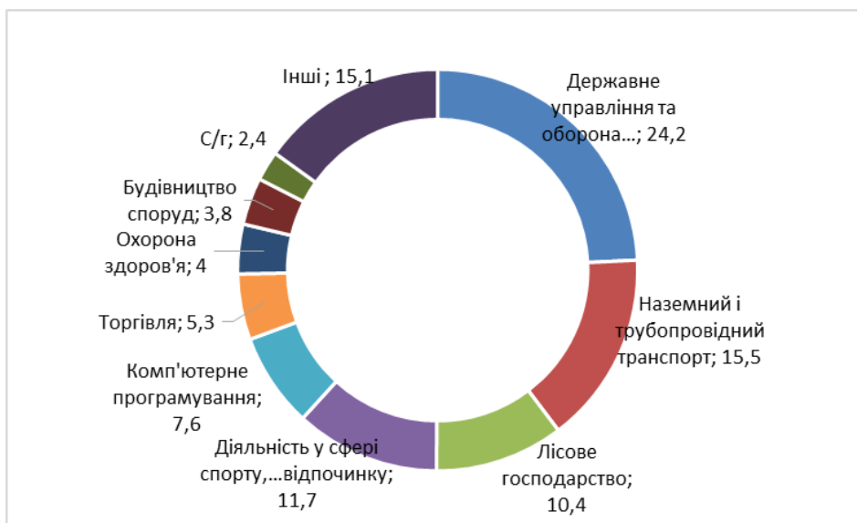
Рис. 1. Структура економіки за внеском видів економічної діяльності до місцевого бюджету Козівської громади, 1 кв. 2022 р.

Аналіз структури економіки громади за сплатою податкових доходів до місцевого бюджету Козівської територіальної громади доводить визначальну роль бюджетного сектора, частка якого сягає 35%. Серед інших видів економічної діяльності до найбільших платників податків слід віднести наземний і трубопровідний транспорт, діяльність у сфері спорту і відпочинку, лісове господарство (рис. 1).